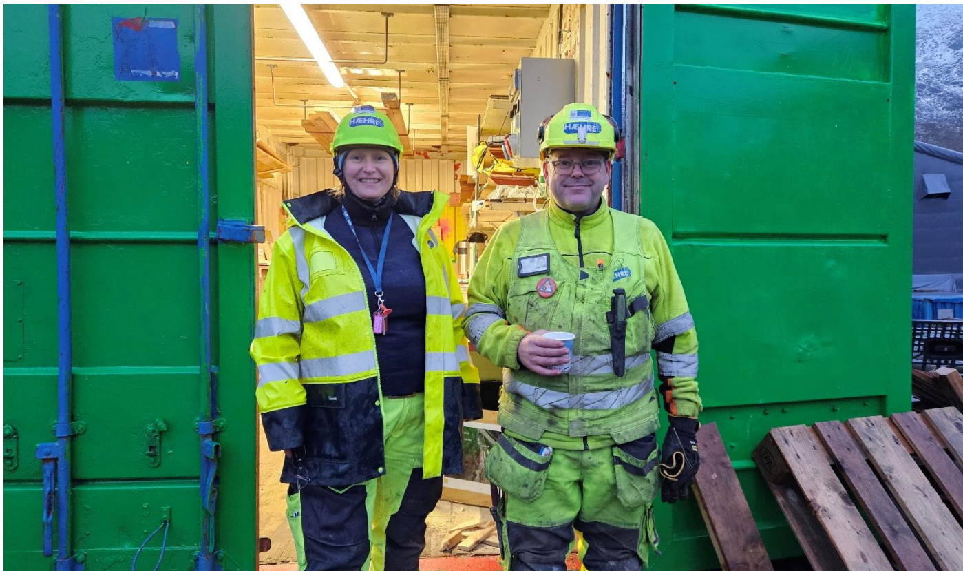
Foto 1 Velkommen til oss