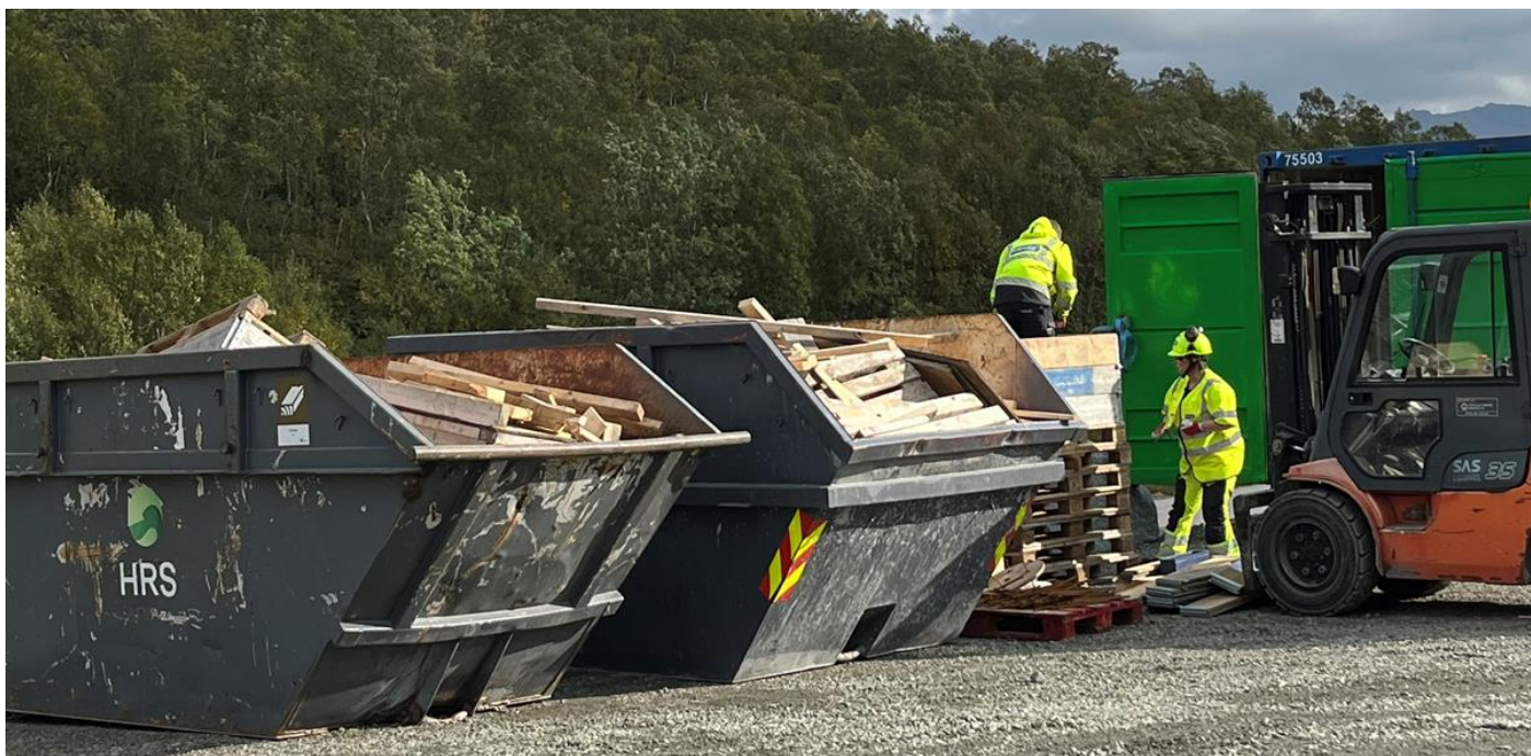
Foto 2 Det skal benyttes verneutstyr