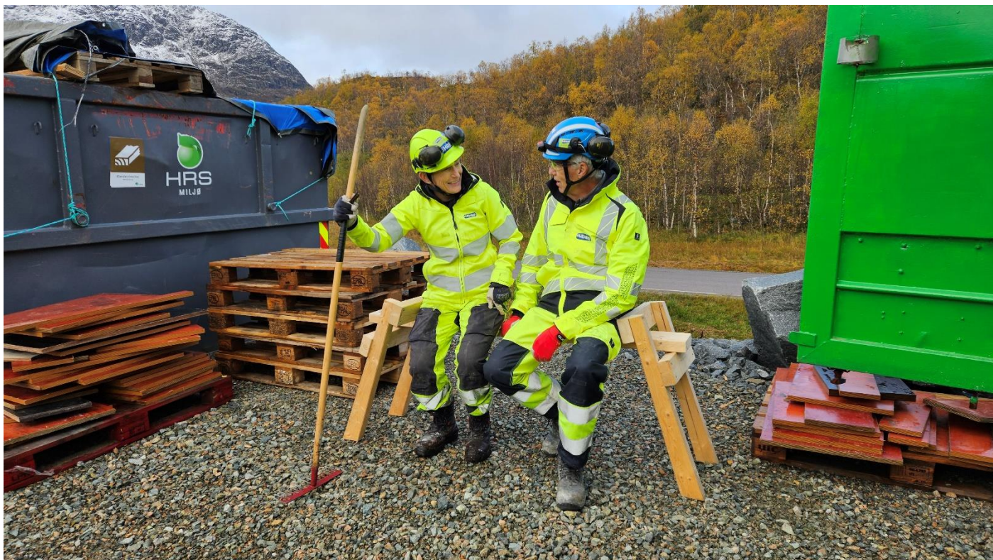
Foto 3 Ytre Miljø leder og Prosjektdirektøren tar en pause på selvlaget benk fra gjenbruksmaterialer